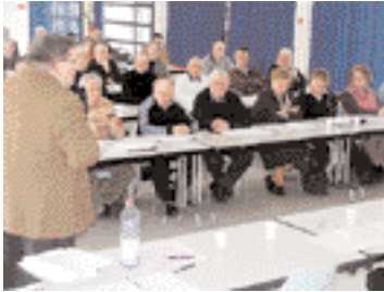
Réunion de formation Eurville-Bienville 1 er mars 2006 Définition de l'intérêt communautaire